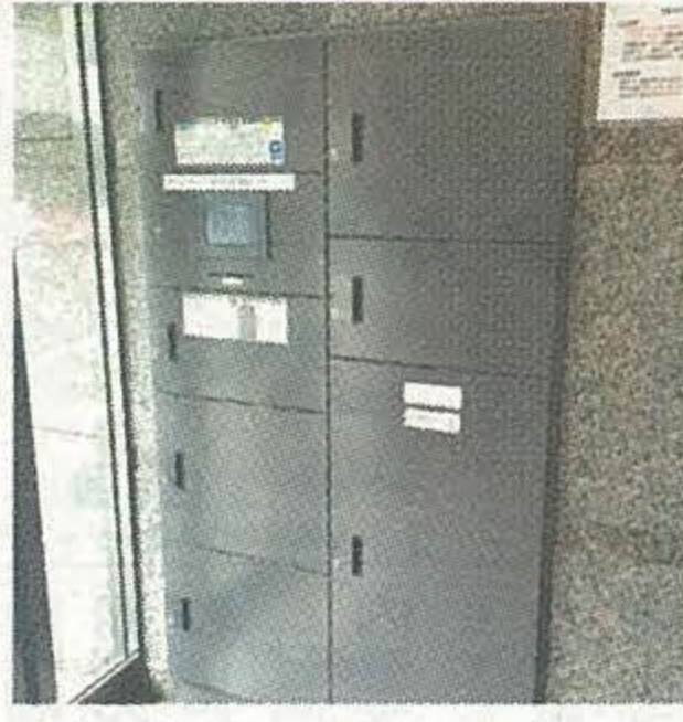
▲宅配ボックスのイメージ写真

再配達問題から集合住宅への普及が加速している宅配ボックスが、不正購入した物品の受け取り場所として利用される危険性が高まっている。4月28日、神奈川県警察本部で行われた空き部屋対策推進連絡会で議題が上がった。