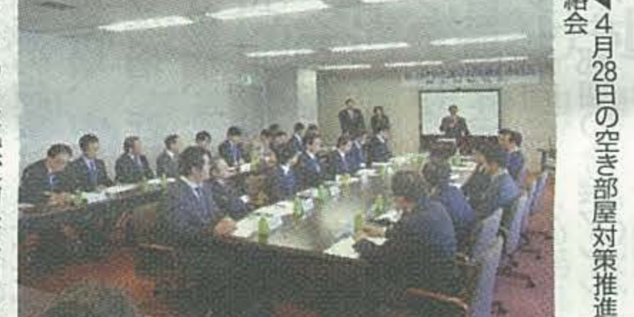
▲4月28日の空き部屋対策推進連絡会

宅配ボックスの普及に伴い、メーカーも警戒を強めている。不正購入した物品の受け取り場所として利用される危険性が高まっている。4月28日、神奈川県警察本部で行われた空き部屋対策推進連絡会で議題が上がった。